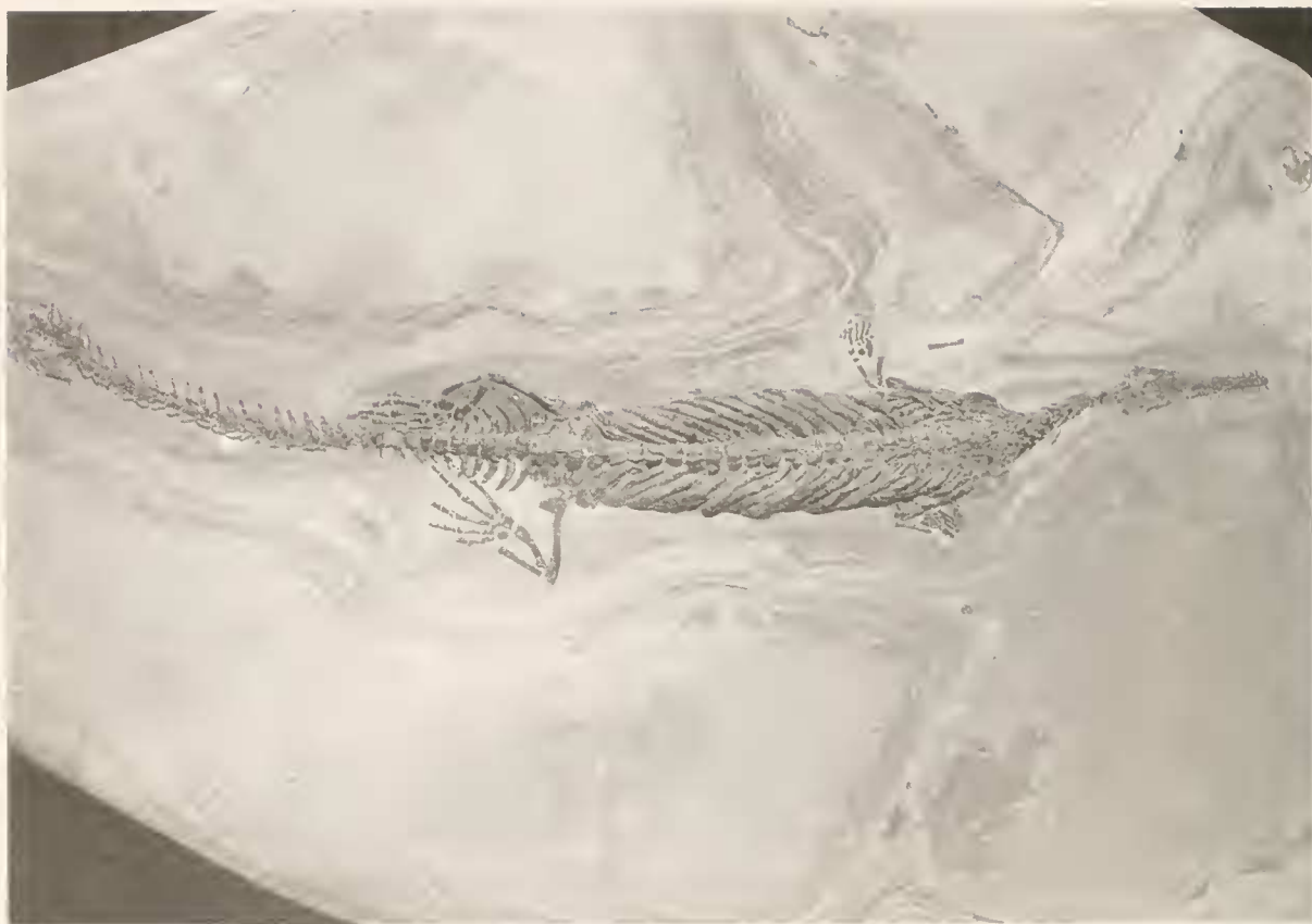
Abb. 3: Stereosternum tumidum , BSP 1997 I 68. Fast vollständiges Skelett, ca. \times \frac{1}{5} nat. Gr.

haltene Caudalwirbel; Cervikalrippen überlappend, anterior langgestreckt, spitz endend, posterior kurz keilförmig; ab Caudalwirbel 13 sind nach posterior keine Processus transversi mehr ausgebildet; Thorakalrippen und Haemapophysen pachyostotisch; Coracoid ungeteilt; linker Tarsus mit 2 Tarsalia proximalia, 6 Tarsalia distalia (2 hintereinanderliegende Knochen auf Höhe von Metatarsale V). Zwischen den Zehen des linken Fußes und der Hand sind Hautabdrücke (? Hautreste) erhalten.